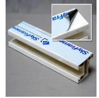
Hot, Ultra Protection solutions